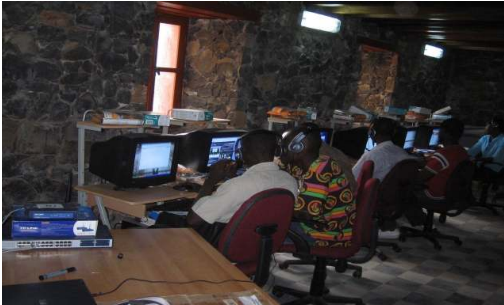
Les jeunes stagiaires de la commune de Gorée , configurant les routeurs wifi durant l'atelier