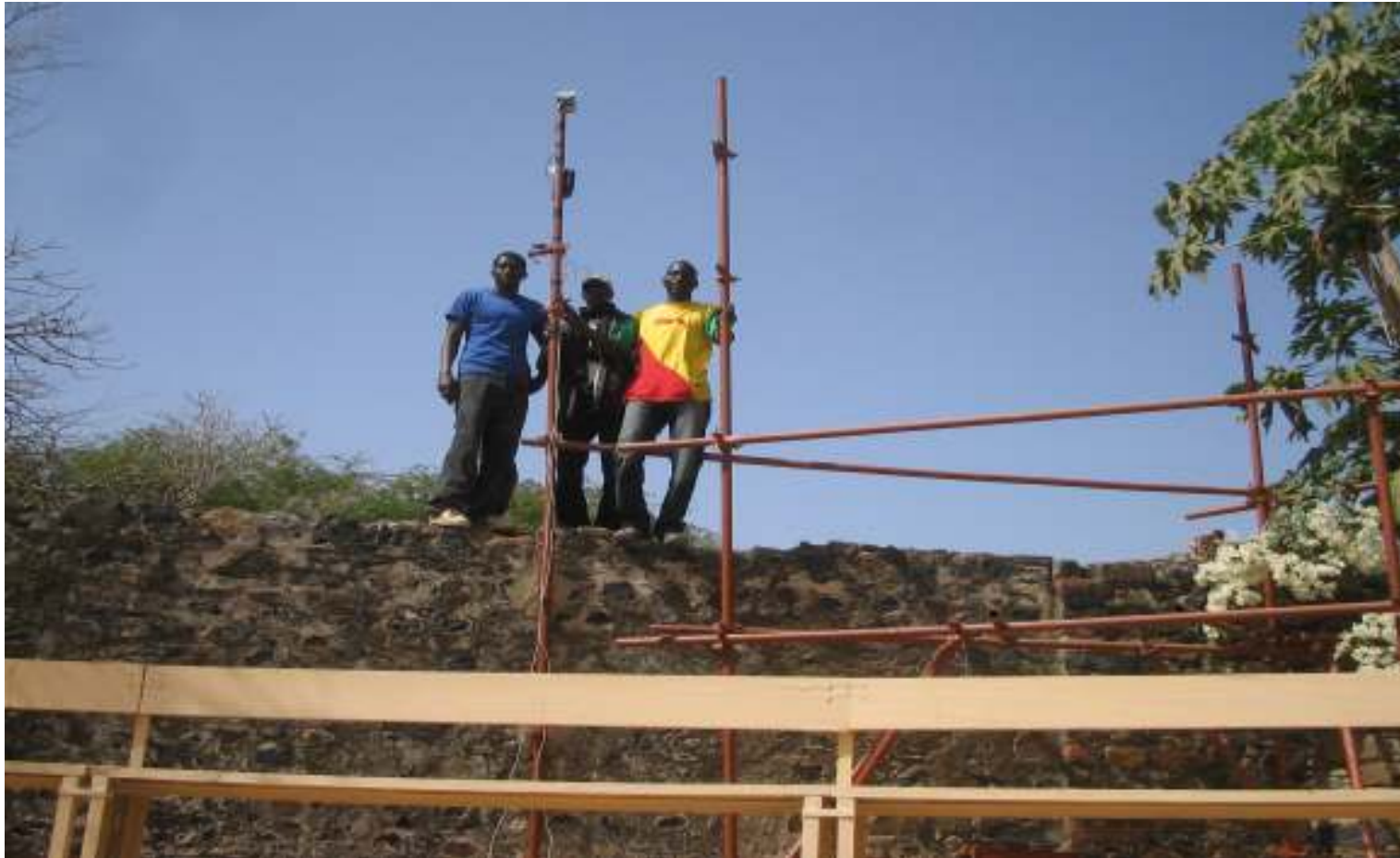
Les jeunes stagiaires installent sur site de Gorée les antennes de fabrication locale